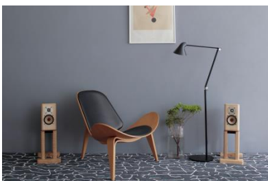
(撮影協力:カール・ハンセン&サン)

プラン2 : 桐スピーカー (内容詳細: 桐スピーカー本体&専用スタンド各2台) セット価格 ¥1,200,000 (税別) 限定5セット